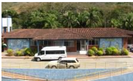
Fachada da recepção e Área administrativa

A APAE de Cachoeiro de Itapemirim se encontra construída em um prédio que nos foi cedido através de um Contrato de Comodato pela Prefeitura Municipal, no ano de 2000. Contamos com uma ampla estrutura equipada com todo o tipo de material necessário ao bom desenvolvimento de nossa equipe junto aos nossos usuários, alunos e pacientes.