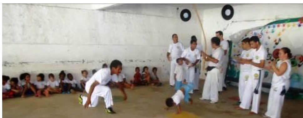
Apresentação na EMEB Carim Tanure