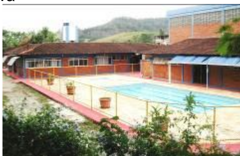
Área da natação e Lazer