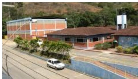
Quadra e refeitório