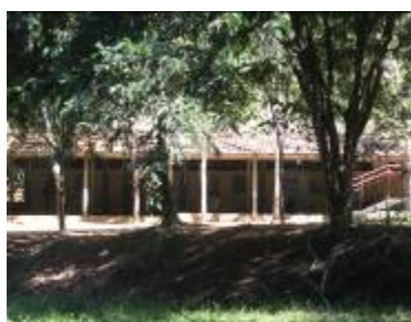
Área de Equoterapia